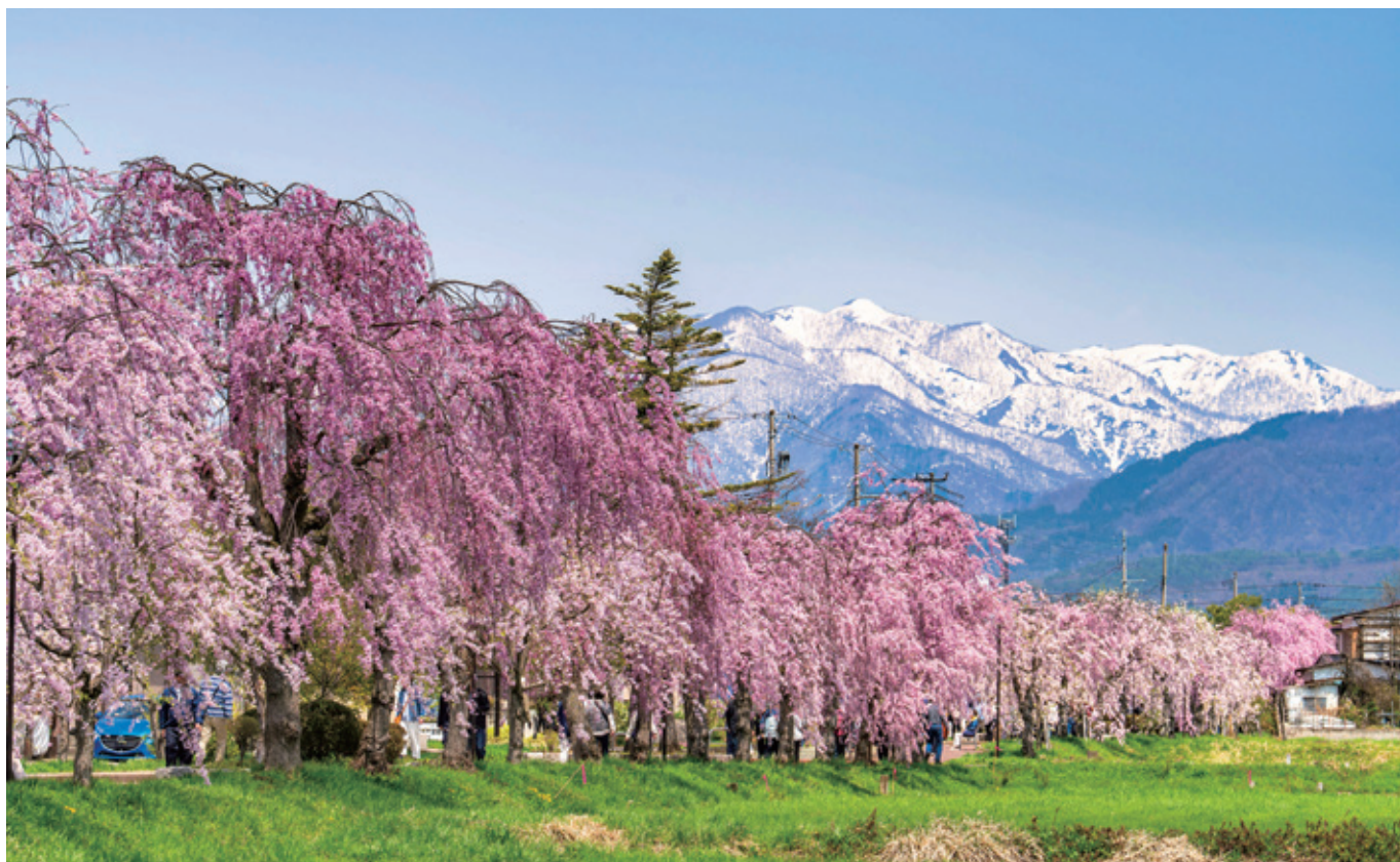
しだれ桜と残雪の飯豊連峰（福島県）